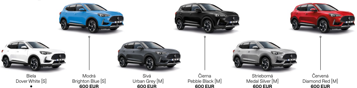
Biela Dover White [S] •